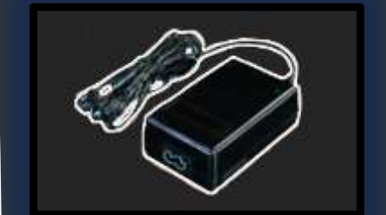
電源製品 組み込み用電源 外部特殊電源 オープンフレーム電源