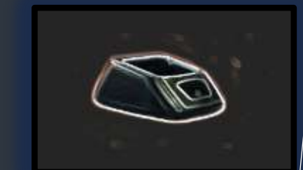
Charger リチウム電池用充電器 ニッケル水素電池用充電器 低ノイズ高性能充電器 2-6 連充電器