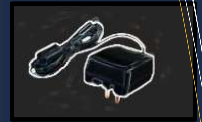
AC Adapter 2.4V から 24V までの多彩な AC アダプター